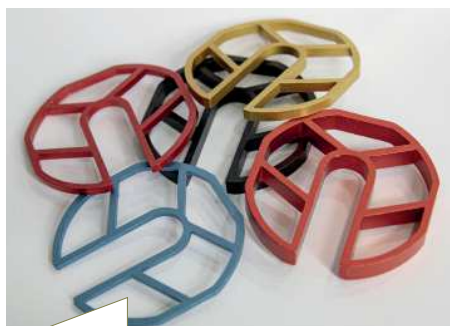
Die farbige Codierung ermöglicht ein schnelles Finden der erforderlichen Stärke.