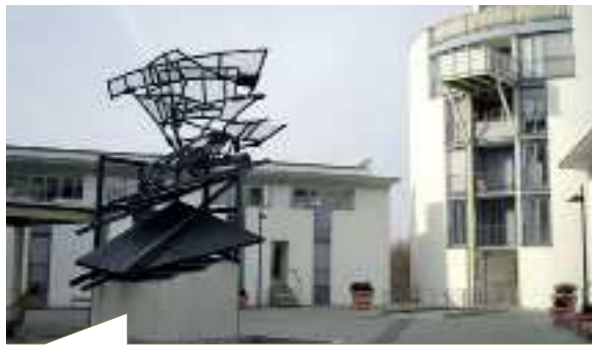
Am Eichbergplatz in Ulm wurden 500 Fenster durch PVC-Fenster ersetzt.

Messwerte wurden automatisch in das Aufmaßprotokoll auf den Tablet-PC übertragen. Noch effizienter und zeitsparender ermöglicht die digitale Aufmaß-App die Arbeit im Team, wenn eine Person die App bedient und eine andere Person die Messung vornimmt. Alle Aufmaßdaten sind projektbezogen und übersichtlich zur Weiterverarbeitung in einer SQL-Datenbank der Auf-